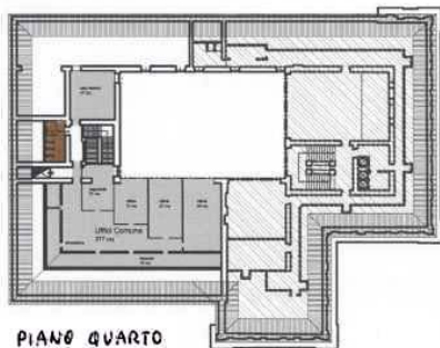
PIANO QUARTO (uffici Comune)

LA PARTE COLORATA DEI VARI PIANI E' ASSEGNATA ALL'ISTITUTO PER LA MEMORIA E LA CULTURA DEL LAVORO DELL'IMPRESA E DEI DIRITTI SOCIALI